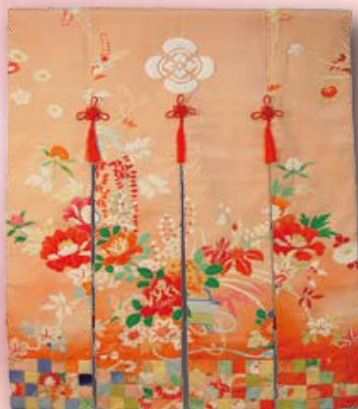
*花嫁のれん (間野節子)