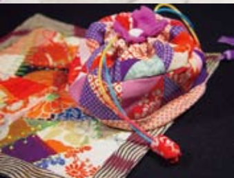
*三角つなぎの桜巾着 (高杉妙子) *クレイジーのミニタペストリー (瀧川光子)