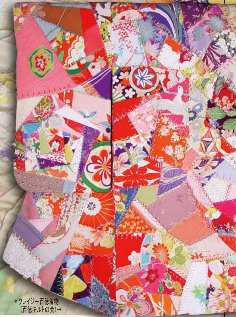
*クレイジー百徳着物 (百徳キルトの会)→