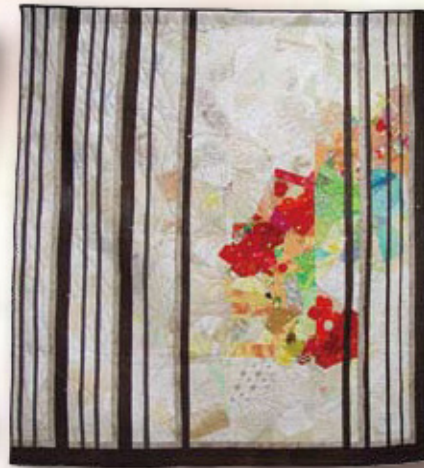
*タペストリー (200cm×180cm) 【加賀の鞋Ⅱ】(奥山裕子)