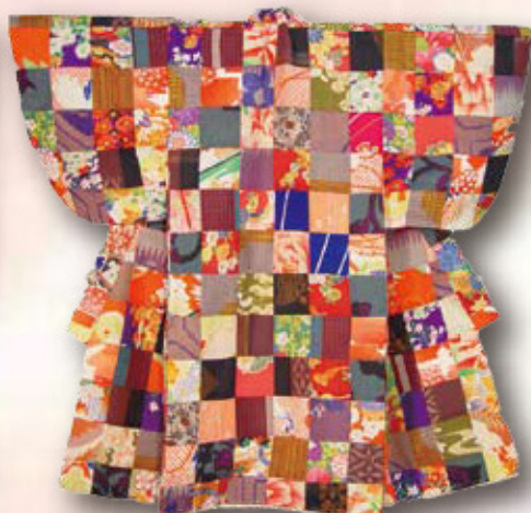
*四角つなぎの百徳着物 (百徳キルトの会)