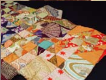
*サンブラー着物タペストリー (寺本康子)