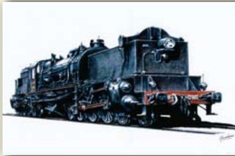
スペイン国鉄 NO.404「ガラート型」(Spain/1931)