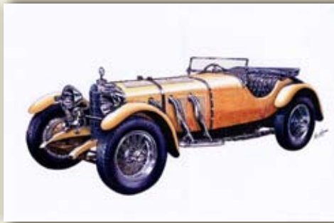
メルセデス ベンツ "SSK" (Germany/1928)