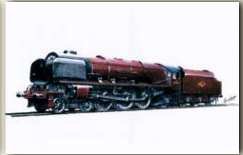
ロンドン鉄道「シティオブノッティンガム」(England/1931)