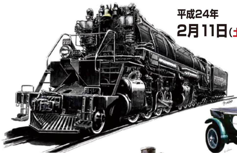
Duluth Missabe & Iron Range s M-4 (USA-1924)