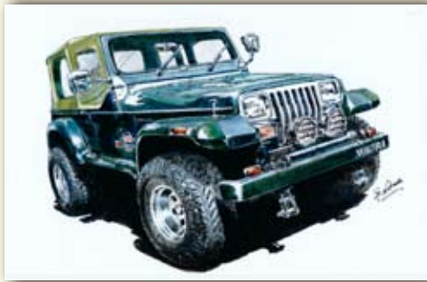
クライスラー ジープ ラングラー (U.S.A./1989)