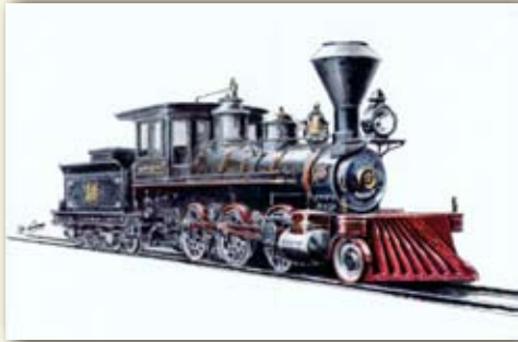
旧国鉄(幌内鉄道) 7100「弁慶」(U.S.A./1880)

実物を見てクロッキー程度のデッサンをし、いろいろな角度から撮影しておいた写真を見ながら鉛筆で下書きをします。その後、黒ペンでアウトラインを決め、カラーインクの薄い色から描き込んでいきます。点描画での作品は、黒ペンで打った点の粗密の変化で立体感を表現しています。