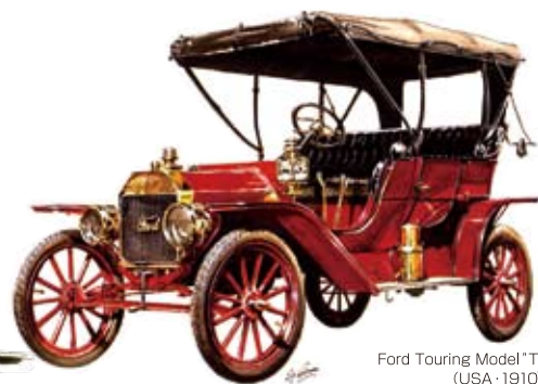
Ford Touring Model "T" (USA-1910)