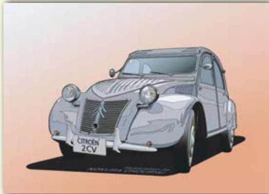
シトロエン 2CV (France/1948)

木を組み込みながらオブジェを作りました。中心に小箱を組み込んで作ったオブジェは、組み立てパズルになっており、バラバラにしないと小箱を開けることができません。