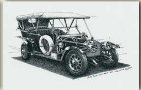
ロールス ロイス "シルバー ゴースト" (England/1910)