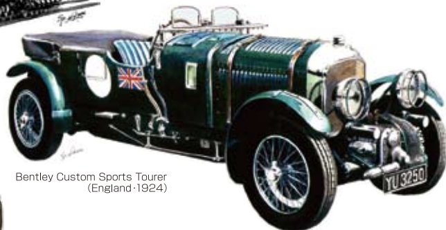
Bentley Custom Sports Tourer (England-1924)