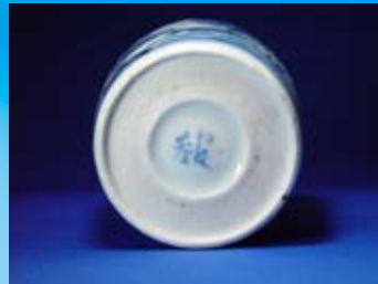
【正文様】(表面に描かれた染付の絵柄) * 中国故事の絵柄で許由巢父文猪口です。