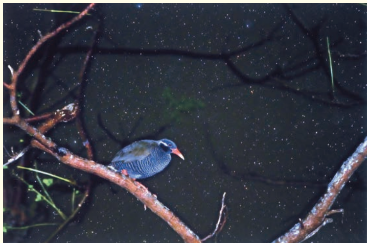
湊 和雄 ヤンバルクイナ