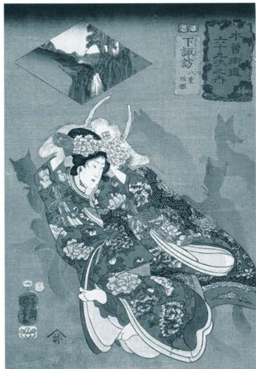
木曾街道六十九次之内 下諏訪 八重垣姫(前期展示)

Sixty-nine Stations on the Kisokaido Highway Created by Utagawa Kuniyoshi