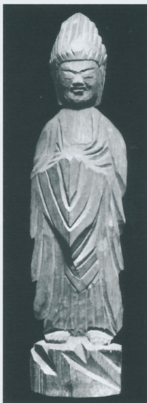
荒神立像(愛知県豊田市・豊田市民芸館蔵)