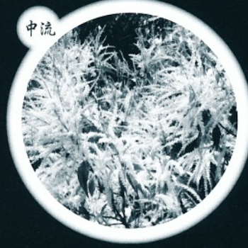
数百年の時間が つくれた照葉樹林