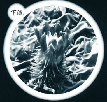
他生物の侵入に耐え 命をつなぐ植物