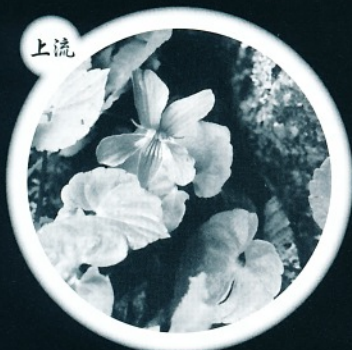
寒さや激流に耐え 命を輝かせる植物

それぞれの環境に適応し生きている植物たちの命は、 短くも美しく、そして力強く輝いています。