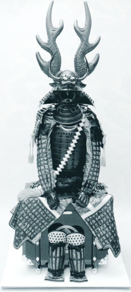
4.「本多忠勝甲冑」(複製)*