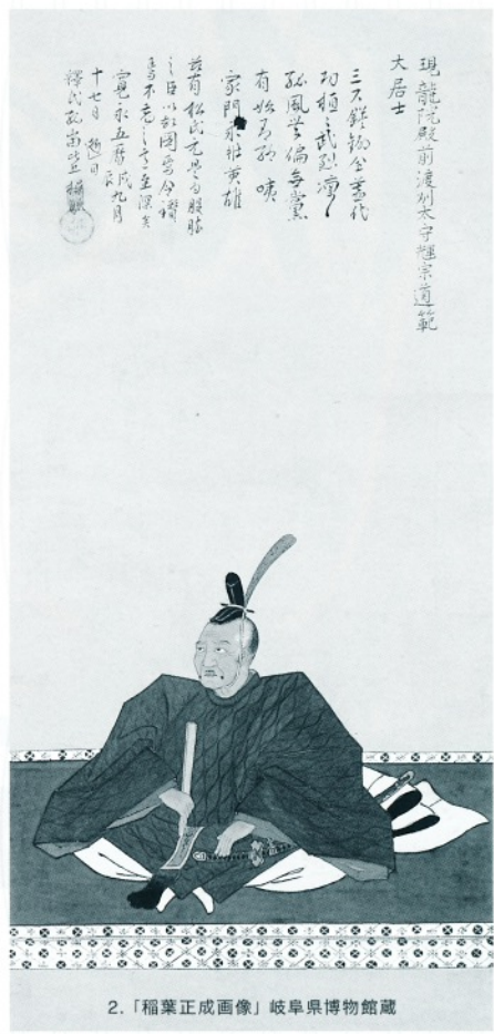
2.「稲葉正成画像」岐阜県博物館蔵

慶長5年(1600)美濃・関ヶ原で繰り広げられた天下分け目の戦い「関ヶ原合戦」、合戦自体はわずか一日で決着が付きましたが、その後200年以上に及ぶ日本の国の仕組みを決定づけた大一番でした。この戦いにおいて美濃の地が果たした役割を、その前哨戦として重要な位置を占める岐阜城合戦(城主織田秀信)を含め考察します。またその後、この合戦が岐阜の人々にいかに語り継がれたかを、各地に伝わる資料により紹介します。