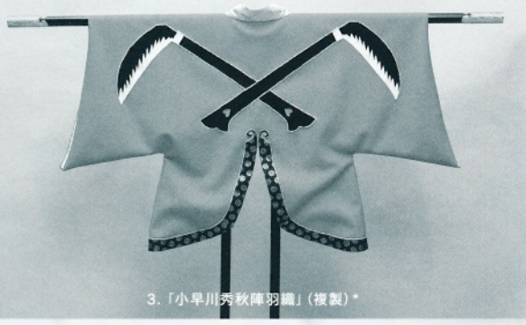
3.「小早川秀秋陣羽織」(複製)*