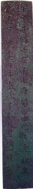
国宝・文祿麻呂墓誌 (東京国立博物館所蔵)