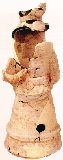
東山田遺跡出土人物埴輪