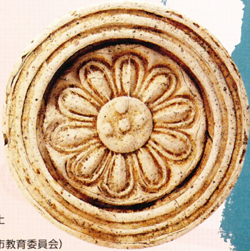
上町遺跡出土軒丸瓦