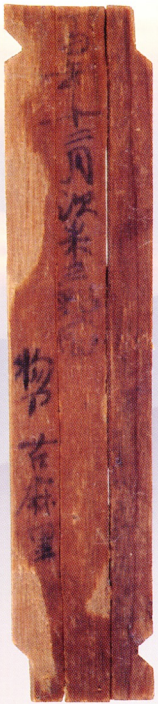
史跡・飛鳥池工房遺跡出土木簡