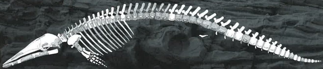
瑞浪産クジラ類化石 Isanacetus sp. cf. laticephalus (制作：府高 航平)

今日では内陸に位置する岐阜も約2,000万年前には海に面し、陸棲の哺乳類と海棲の哺乳類が繁栄した「大哺乳類時代」にありました。本企画展では、瑞浪層群から見つかった新生代の哺乳類化石をテーマに、世界的にも貴重であり、ウマやバクの仲間にあたる絶滅哺乳類のカリコテリウム、指がまだ3本あった基盤的なウマの仲間であるヒラマキウマ、そして2016年に発掘された瑞浪産のクジラ類化石などを展示・紹介します。また、瑞浪市化石博物館の所蔵標本約50点も加えた貴重な化石資料群を一堂に集め、2,000万年に亘る「岐阜の成り立ち」について、古生物学的・地質学的観点から迫ります。