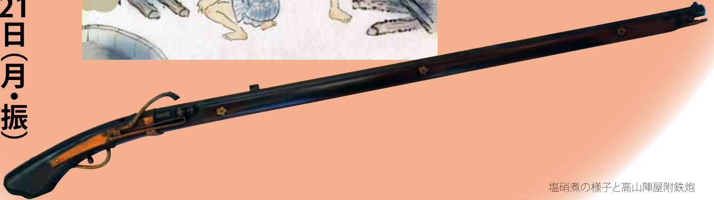
塩硝煮の様子と高山陣屋附鉄炮