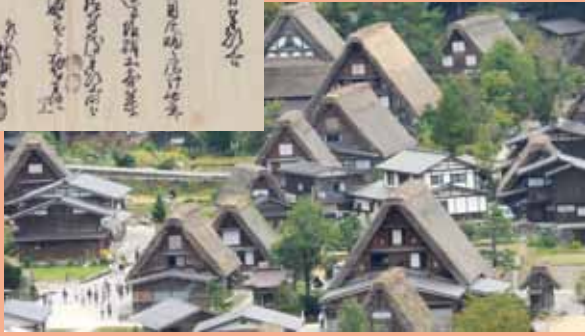
塩硝製造が盛んに行われていた白川郷合掌集落