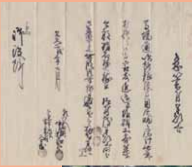
塩硝生産に関する高山陣屋文書