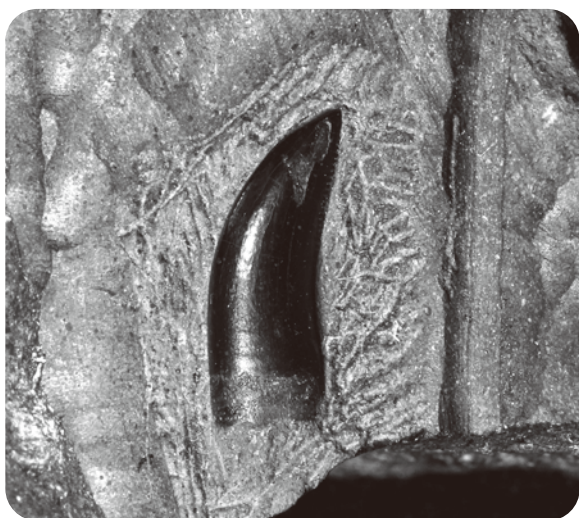
荘川産の獣脚類(恐竜)の化石

このたびの移動展では、飛騨が世界に誇る豊かな自然について、岐阜県博物館や高山市が所蔵する標本や模型により紹介します。飛騨地方の県民の皆様をはじめ、観光客の方々にも、飛騨特有の自然への関心を深めていただく機会となれば幸いです。