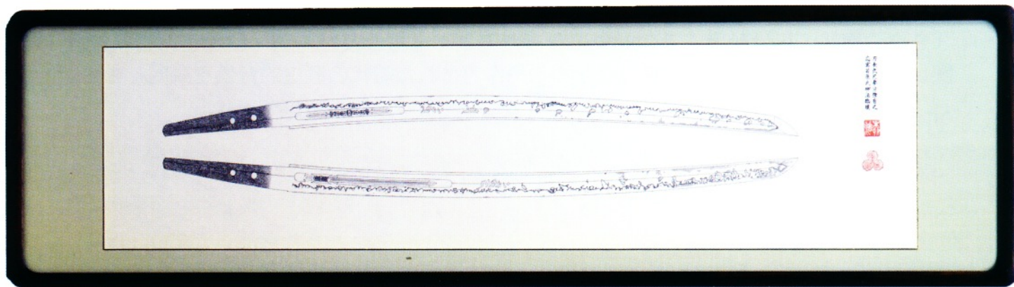
—押形 小太刀 相州住廣正—