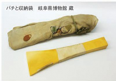
バチと収納袋 岐阜県博物館蔵