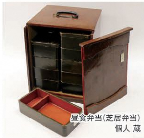
昼食弁当(芝居弁当) 個人蔵