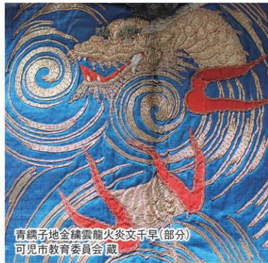
青縹子地金縷雲龍火炎文千早(部分) 可見市教育委員会蔵