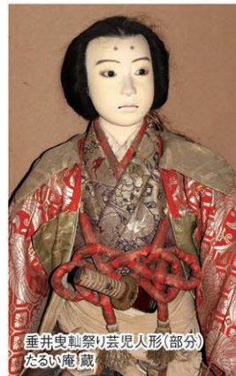
垂井曳船祭り芸児人形(部分) たるい庵蔵