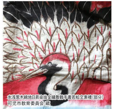
水浅葱木綿地日昇染金縷舞鶴手書若松文素襖(部分) 可見市教育委員会蔵