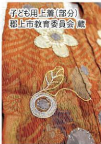
子ども用上着(部分) 郡上市教育委員会蔵