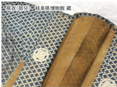
肩衣(部分) 岐阜県博物館蔵