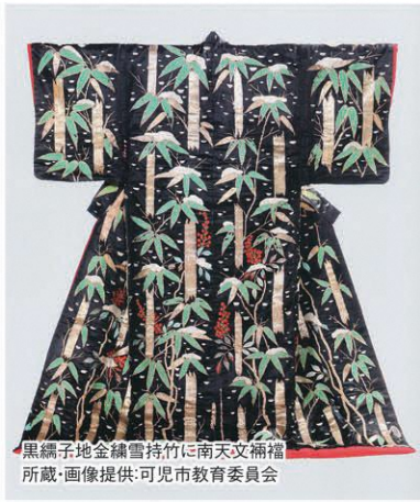
黒縹子地金縷雪持竹に南天文桐福所蔵・画像提供:可見市教育委員会