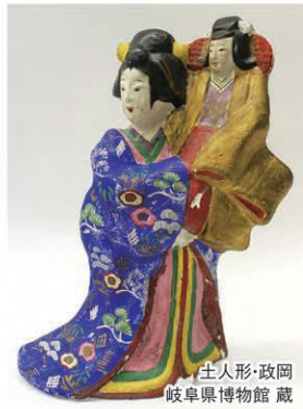
土人形・政岡 岐阜県博物館蔵