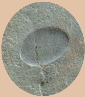
ディッキンソニア