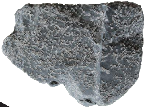
シュードロミンゲリア