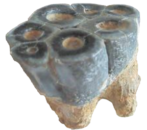
デスモスチルスの歯