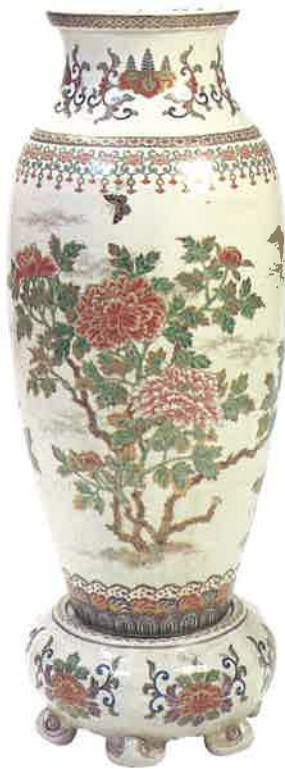
錦手牡丹文花瓶 薩摩 苗代川系 十二代沈器官 明治時代中期 鹿児島県歴史・美術センター黎明館

幕末から明治初期に欧米で絶賛され、工芸のジャポニズムを沸きおこした絢爛豪華な「薩摩焼」、そして波平一派に代表され、その歴史は平安時代にまでさかのぼる「薩摩刀」の魅力について、鹿児島県歴史・美術センター黎明館の所蔵品を中心として紹介していきます。