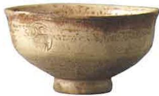
白釉茶碗 銘すはま 薩摩 御判手 江戸時代初期 個人蔵 (鹿児島県歴史・美術センター黎明館保管)