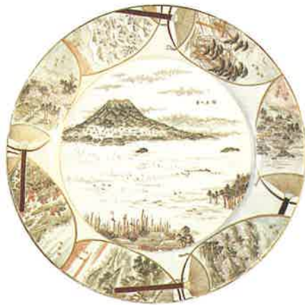
錦手鹿児島八景図大皿 薩摩 登野系 慶田政太郎 山下雪山絵付 明治31-大正2年頃 鹿児島県歴史・美術センター黎明館