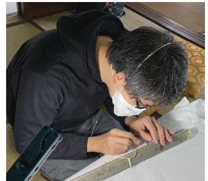
文化財レスキュー中の講師

資料保存という活動のなかから浮かび上がる歴史文化継承の課題と可能性についてお話しします。