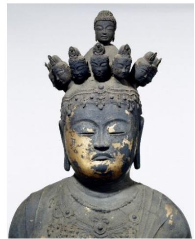
十一面観音立像（美江寺蔵）

県博物館では、学芸講座「美濃の仏像」を開催します。美濃の仏像の歴史と特徴について、美濃地方の寺院を巡り調査した専門家を講師に迎え、多様な作風や制作技法についてお話しします。仏像の変革期にあたる奈良時代から平安時代前期に制作されたものを中心に、国の指定文化財である十一面観音立像（美江寺蔵）や菩薩坐像（臨川寺蔵）についての解説もありますので、ぜひご来場ください。