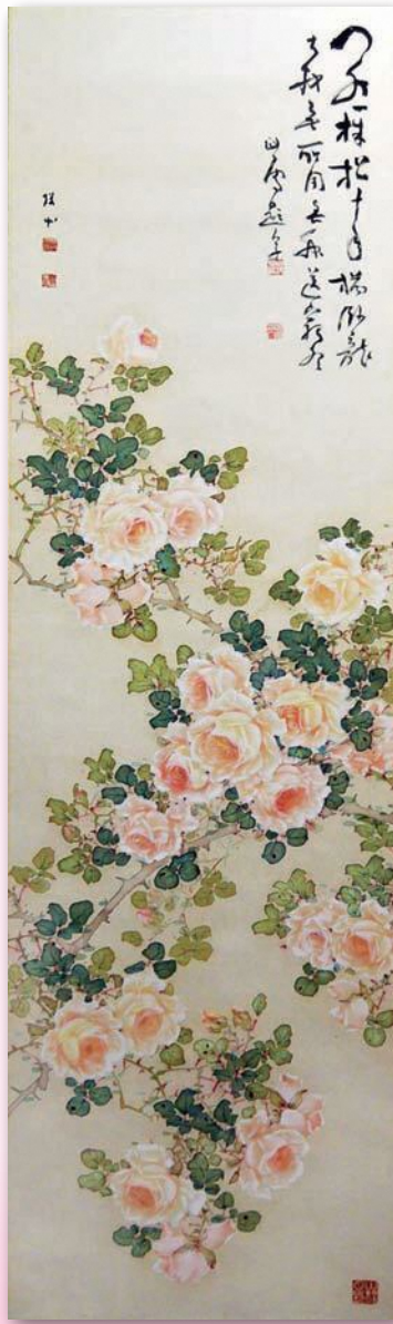
薔薇図(橋本関雪讃)