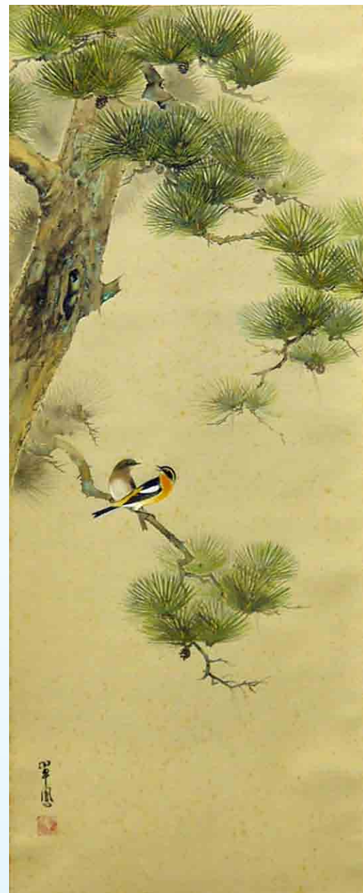
夫婦小禽松之図(1987年)