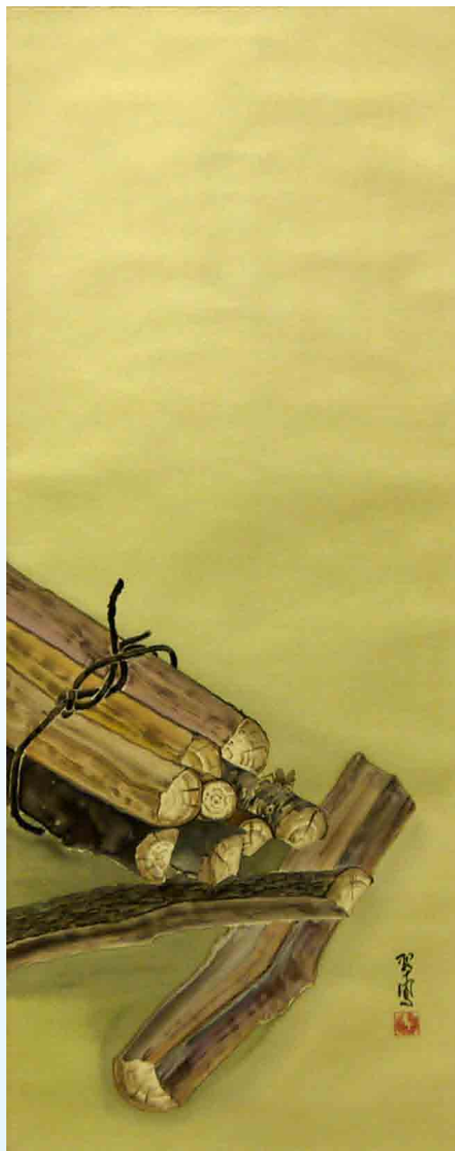
薪に鈴虫之図(1980年代)