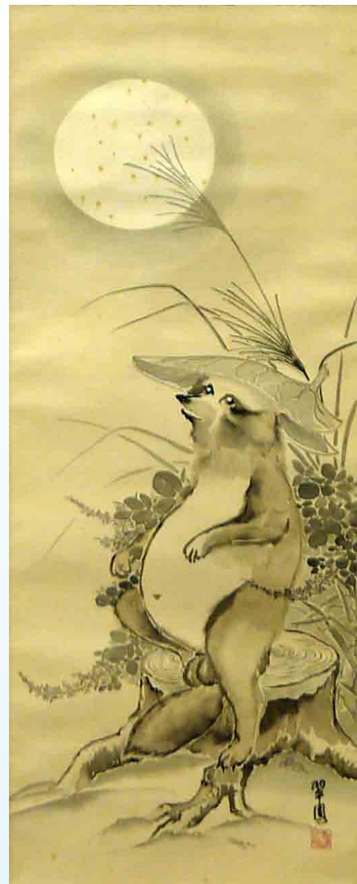
月下に狸之図(1970年代)