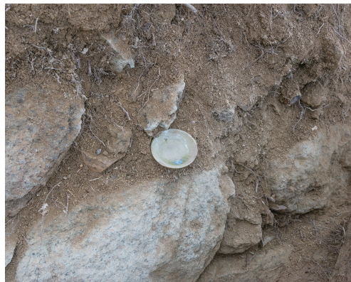
姉小路氏城館跡 瀬戸美濃焼出土土状況