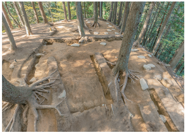
姉小路氏城館跡・古川城跡 見つかった礎石建物跡

その岐阜の城館跡について、特に国指定史跡を目指して、現在調査研究が進められている事例を中心に紹介します。また、城館が語る岐阜の戦国をふりかえります。