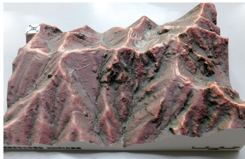
大桑城跡 赤色立体模型 (山県市教育委員会)