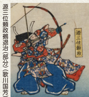
源三位頼政鶴退治(部分)(歌川国芳)