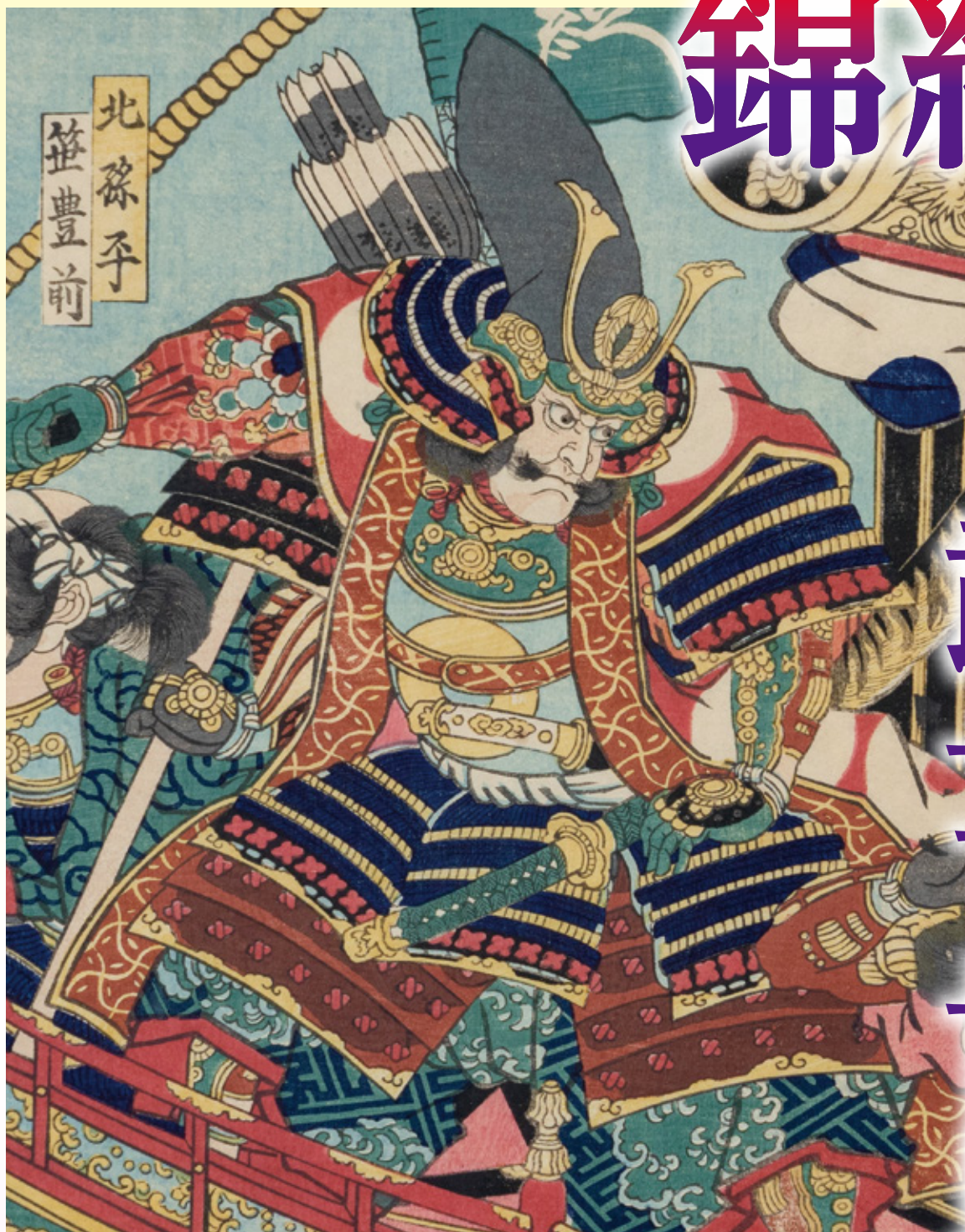
歌川国綱 佐藤正清軍配置図 (部分)