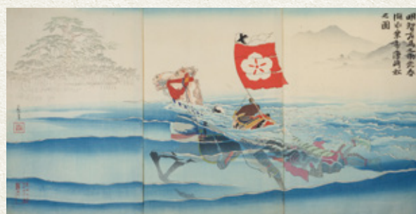
明智左馬之助光春湖水乗打唐崎松之図(小林清親)