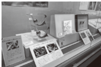
▲雑草とよばないで展示風景

秋には特別展「尾張徳川家ゆかりの美濃刀」を予定しており、徳川美術館刀剣コレクションか