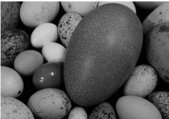
▲岐阜大学の卵コレクション(中央はヒクイドリ)