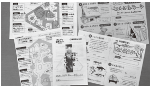
▲みどころガイドや探検シートの一例

そんな多様な楽しみ方に対して、それぞれにお勧めしたいものが、以下のガイドたちです。