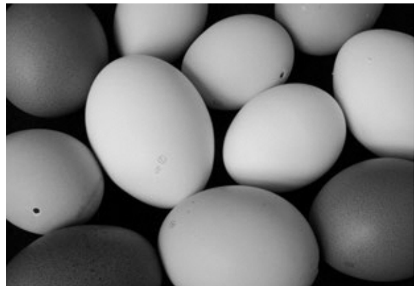
▲ニワトリの卵も美しい