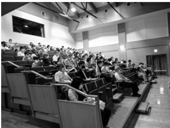
▲莊川化石フォーラム2022「講演会」の様子