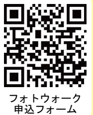
フォトウォーク 申込フォーム