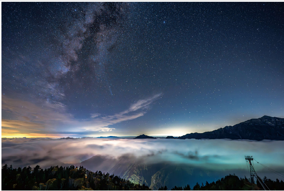
星空鑑賞便