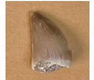
は モササウルスの歯