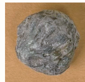
さんようちゅう 三葉虫(大)