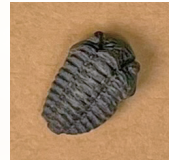
さんようちゅう 三葉虫(小)