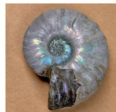
にじいろ 虹色アンモナイト